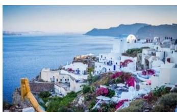
Obraz 1a. oryginalny obraz