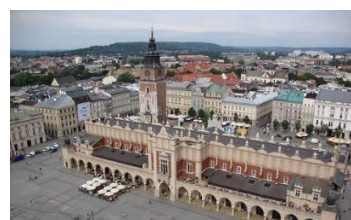
Obraz 1c. Po odcięciu dolnej części obrazu