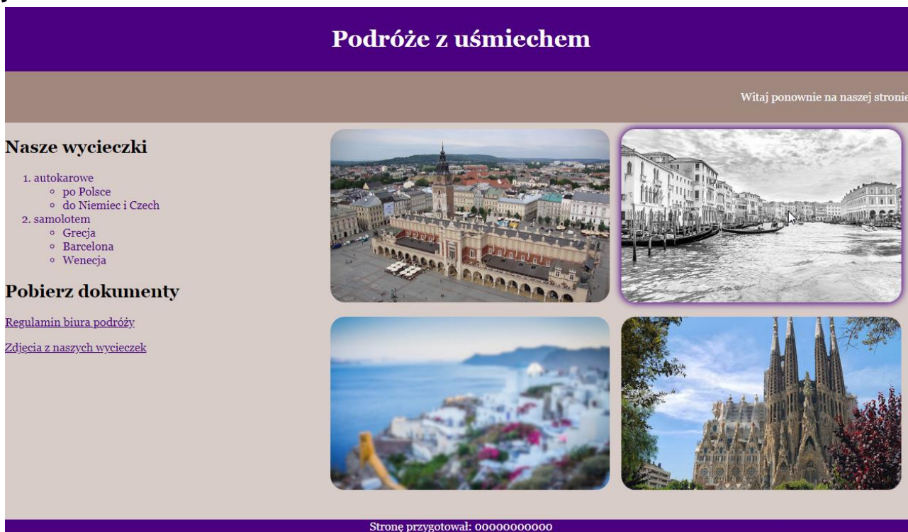
Obraz 2. Witryna internetowa, strona odwiedzana po raz kolejny, kursor na grafice wlochy.jpg